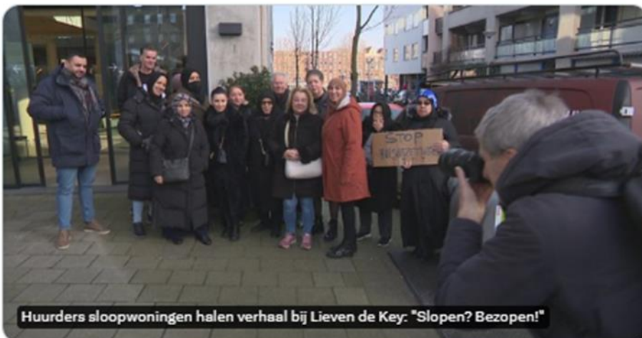
Huurders sloopwoningen halen verhaal bij Lieven de Key: "Slopen? Bezopen!"